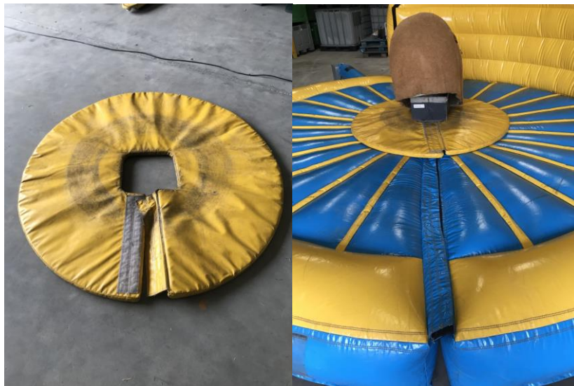
#10 plaats het beschermerschuim bij een opgeblazen valkussen om de rodeo stier.